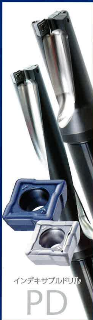
インデキサブルドリル