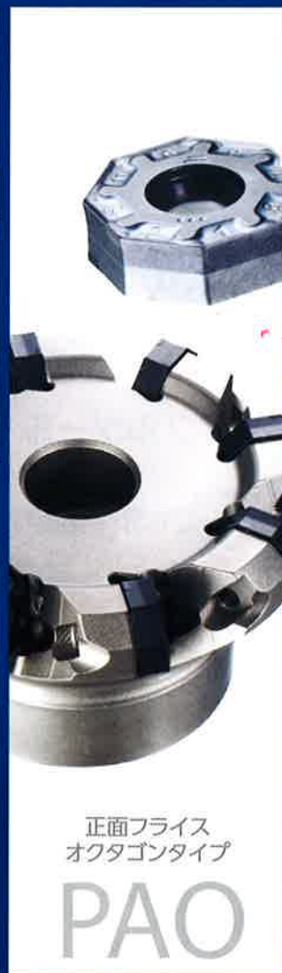
正面フライス オクタゴンタイプ